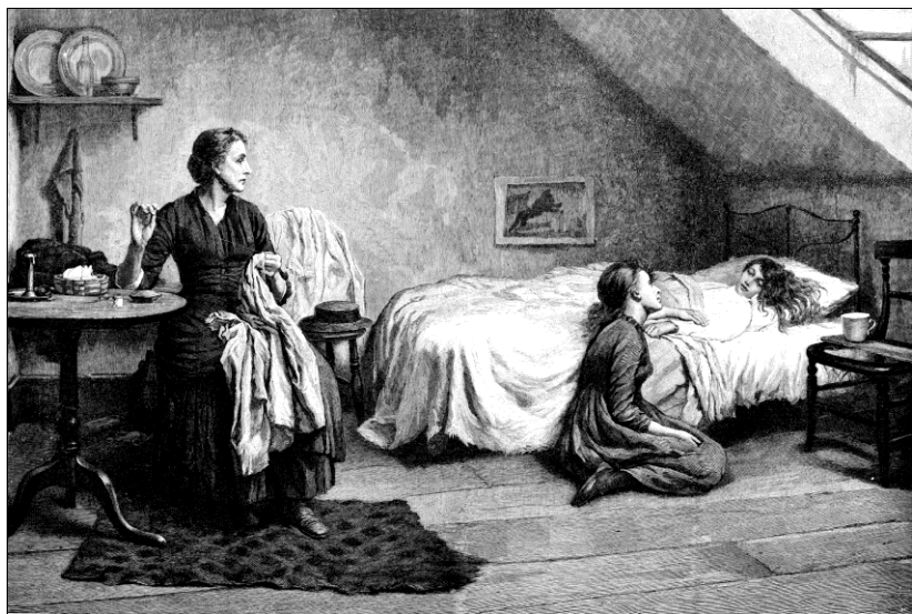
«Вдова и сироты». Гравюра Т. Б. Кеннингтона из журнала «Иллюстрированные лондонские новости». 1888

она похоронила мужа и теперь вынуждена в одиночку содержать семью. Чтобы хоть как-то прокормиться, ей нужно сшить две дюжины рубашек в день. Работать приходится всем. Младшая дочь, тощая девочка лет десяти, торгует кресс-салатом, разнося его по домам. Старшая девочка, уже подросток, сортирует на фабрике грязные тряпки, которые затем идут на производство бумаги. Тряпки воняют, по ним ползают вши и прыгают блохи. Наверное, именно так в дом проник сыпной тиф, от которого скончался маленький сынишка. Его тело уже второй день лежит на сдвинутых ящиках из-под апельсинов. Похоронить его не на что, сначала нужно дождаться выручку за рубашки. Заметив приоткрытую дверь, вдова прищуривается, а потом обрушивается на вас поток ругани. Не обижайтесь. Она приняла вас за проповедника, который принес ей религиозный трактат в качестве утешения. Пожалуй, нам лучше уйти.