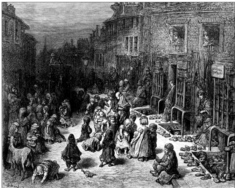
Дети трущоб. Рисунок Гюстава Доре из книги «Паломничество». 1877

Уроженец Дублина, Барнардо прибыл в Лондон, чтобы обучиться медицине, а затем врачевать страждущих где-нибудь в Китае. Но познакомившись с Ист-Эндом, Барнардо задержался в Лондоне — вряд ли Китай переплюнет такое убожество. Всю свою энергию он направил на самых маленьких обитателей трущоб, голодных оборвышей, которых англичане называли «уличными арапчатами». Кого-то находили его помощники во время ночных рейдов, кого-то к нему приводили родители, но, так или иначе, все дети в приютах Барнардо получали еду, одежду и образование. Мальчиков готовили к работе в мастерских или отправляли юнгами во флот, из девочек растили трудолюбивых служанок. Возможно, это были не самые желанные профессии, но выбирать беспризорникам не приходилось.