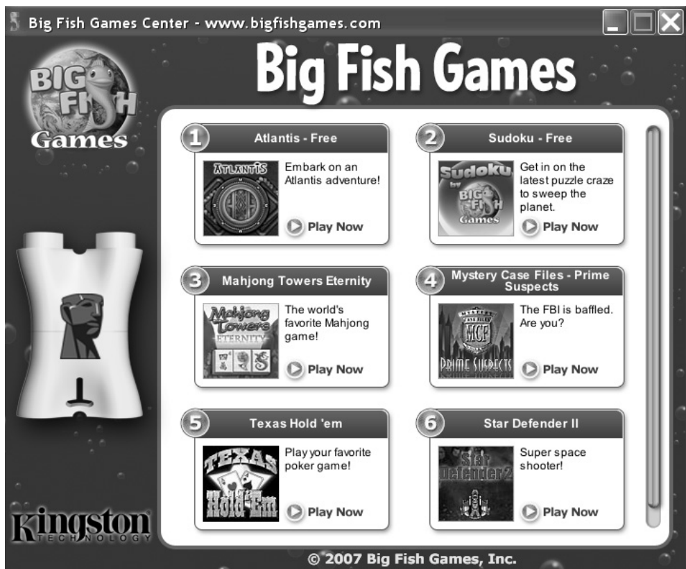
Рис. 1.1. Меню для выбора игр в накопителе DT Mini Fun фирмы Kingston Technology

Не обойдены вниманием и любители игр на компьютерах. Подробное рассмотрение данного типа накопителей выходит за пределы задач, решаемых в данной книге.