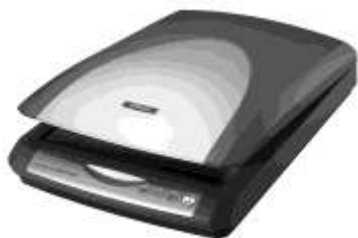
Рис. 1.9. Сканер EPSON Perfection 2480 Photo