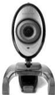
Рис. 1.12. Веб-камера компании Creative

Веб-камера (рис. 1.12) — это такой же цифровой фотоаппарат или видеокамера, но с техническими характеристиками, которые позволяют лишь передавать видеоизображение через Интернет. Для получения фотографий даже размером 9×12 или съемки видеофильмов для просмотра их на телевизоре такие устройства не годятся, т. к. размер картинка мал и ее качество недостаточно высоко. Лишь редкие модели веб-камер могут заменить в какой-то степени цифровой фотоаппарат.