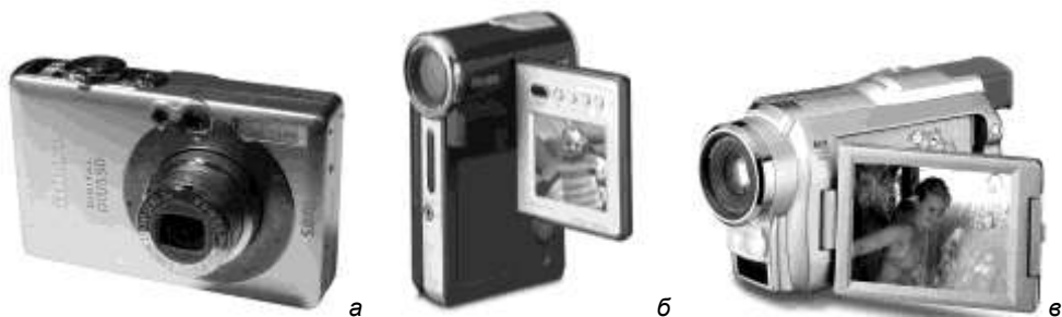
Рис. 1.11. Цифровые камеры: а — цифровой фотоаппарат Canon IXUS 50; б — видеокамера MPEG-4 Samsung; в — видеокамера Samsung

Развитие полупроводниковых технологий позволило в качестве устройств ввода графической информации использовать цифровые камеры — цифровые фотоаппараты (рис. 1.11, а ) и цифровые видеокамеры формата MPEG-4 (рис. 1.11, б ). Современные цифровые фотокамеры ныне превосходят по техническим характеристикам самые совершенные традиционные фотокамеры. Цифровые видеокамеры, несмотря на свои небольшие габариты, позволяют снимать полноценные любительские фильмы. Причем следует заметить, граница между цифровыми фотокамерами и видеокамерами уже стирается: ряд моделей фотоаппаратов могут делать видеоролики со звуком, а видеокамеры — работать в режиме съемки одиночных кадров. Но и обычные видеокамеры (рис. 1.11, в ) становятся все ближе к компьютерам, так как в современной видеокамере используется не только компьютерная оцифровка видеосигнала, но становятся очень популярными для записи малогабаритные винчестеры и малогабаритные DVD-диски.