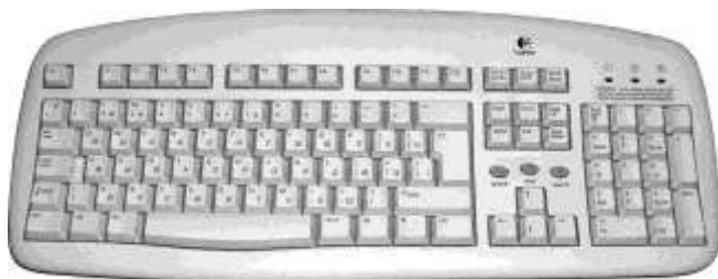
Рис. 1.3. Клавиатура Logitech

Клавиатура (рис. 1.3) позволяет человеку ввести в компьютер ряд символов, чтобы дать команду на выполнение той или иной задачи или набрать какой-либо текст, скажем, отчета или книги. Без клавиатуры просто невозможно полноценно использовать компьютер для решения текущих задач, хотя инженеры усиленно работают над тем, чтобы человек мог общаться с компьютером с помощью так называемого пера и голоса. Несмотря на разнообразие клавиатур в компьютерных магазинах, принципы их работы и внутренняя конструкция практически одинаковы. При покупке клавиатуры, если не подходить с точки зрения минимальной цены, желательно выбирать модель с удобными клавишами и качественной пластмассой, что позволит обеспечить ее долговременную работу и уменьшить утомляемость при работе.