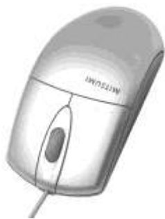
Рис. 1.5. Манипулятор "мышь" производства компании Mitsumi

Для домашних компьютеров, и реже для офисных, в обязательный комплект входят звуковые колонки (рис. 1.6). Количество звуковых колонок может быть от 2 до 8. Их габариты зависят от требований пользователя к красоте и чистоте звука.