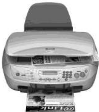
Рис. 1.10. Многофункциональное устройство EPSON CX6600

Развитие полупроводниковых технологий позволило в качестве устройств ввода графической информации использовать цифровые камеры — цифровые фотоаппараты (рис. 1.11, а ) и цифровые видеокамеры формата MPEG-4 (рис. 1.11, б ). Современные цифровые фотокамеры ныне превосходят по техническим характеристикам самые совершенные традиционные фотокамеры. Цифровые видеокамеры, несмотря на свои небольшие габариты, позволяют снимать полноценные любительские фильмы. Причем следует заметить, граница между цифровыми фотокамерами и видеокамерами уже стирается: ряд моделей фотоаппаратов могут делать видеоролики со звуком, а видеокамеры — работать в режиме съемки одиночных кадров. Но и обычные видеокамеры (рис. 1.11, в ) становятся все ближе к компьютерам, так как в современной видеокамере используется не только компьютерная оцифровка видеосигнала, но становятся очень популярными для записи малогабаритные винчестеры и малогабаритные DVD-диски.