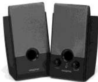
Рис. 1.6. Звуковые колонки

Следует отметить, что независимо от всех технических параметров, звуковые колонки не относятся к компьютерной технике, т. к. обеспечивают лишь воспроизведение звука, который полностью формируется звуковой картой (рис. 1.7), находящейся внутри компьютера. Соответственно, выход звуковой карты всегда можно подключить к самому обычному музыкальному центру, кстати, это более экономически оправданное решение, нежели покупка доро-