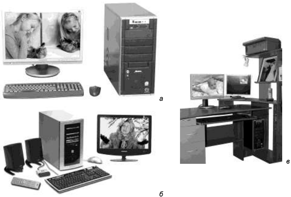
Рис. 1.1. Рабочие места: а — персональный компьютер с жидкокристаллическим монитором со встроенными звуковыми колонками; б — мультимедийный набор для персонального компьютера HP Media Center; в — домашнее компьютерное рабочее место

Обратите внимание на лампу подсветки на рис. 1.1, в. Хотя жидкокристаллические мониторы и безопасны, но без внешней подсветки глаза быстро устают, поэтому в полной темноте работать за компьютером не рекомендуется .